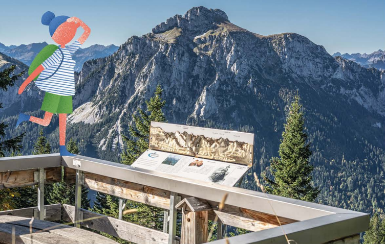
Ausblicke, die das Herz berühren